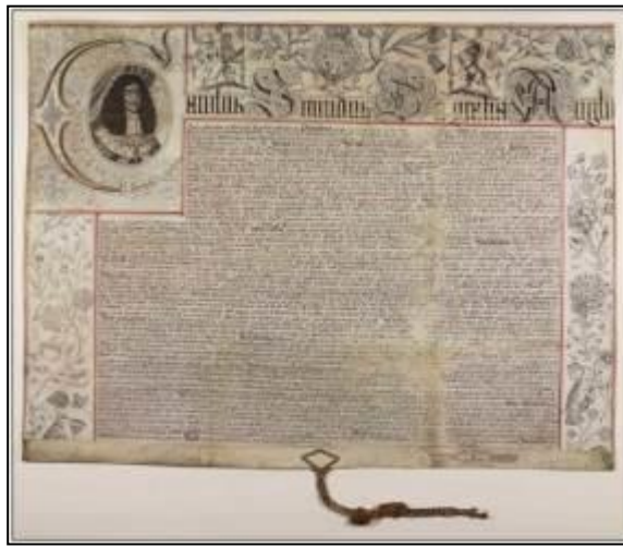
InspeXimus of English Stock Patent, 10 Aug 1667