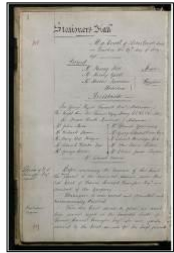
Rough court minute book volume 24