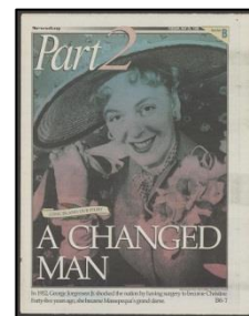
アメリカ初の性適合手術を行った女優 Christine Jorgensen に関する新聞記事