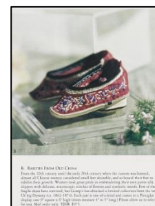
中国の纏足の広告