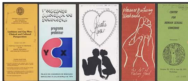
性に関するパンフレット類

性的行動、性的嗜好、衛生、健康や家庭および人間関係、性についてのグローバルおよび地域的観点からとらえた比較、性同一性、性教育、生殖、芸術と文学、各種団体・学会・関連資料 等