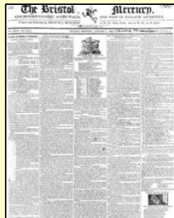
Bristol Mercury (Part I に収録)