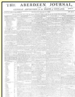
Aberdeen Journal (Part IV に収録)