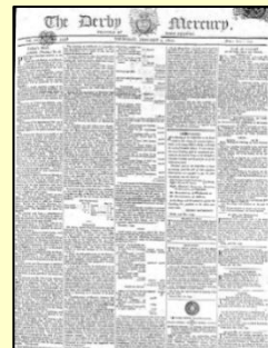
Derby Mercury (Part I に収録)