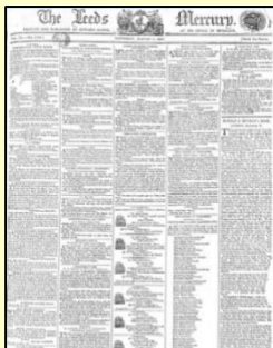
Leeds Mercury (Part III に収録)