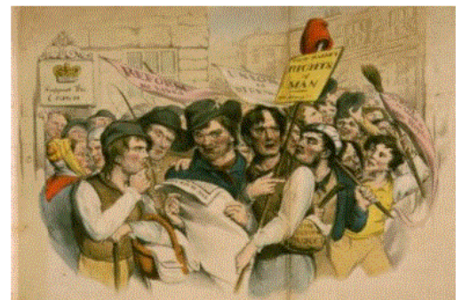
Illustration of London's Reform Riots of 1831, during which citizens protested the House of Lords' second rejection of the Reform Act, which included sections on suffrage and reshaping of electoral districts.

「British Politics and Society」アーカイブは、内務省文書、政治家の個人文書から、当時の労働者階級の自伝まで収録するもので、その内容は、手稿、地図、新聞、雑誌、通信、日記、写真、ポスター、パンフレットなど、170 万ページに及びます。19 世紀の政治と社会の関係を探る上で、新たな発見をもたらす資料群です。英国の国内および対外政策、労働組合、チャーチスト運動、ユートピア社会主義、急進派、地図製作、教育、宗教等の研究にご活用いただけます。