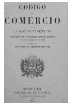
『アルゼンチン商法典』(1865)

『パラグアイ共和国刑法典 公式版』(1880) 『パラグアイ共和国刑法典』(1892) テオドシオ・ゴンサレス『刑法典改正草案理由書に関する若干の所見』(1896) 『パラグアイ共和国刑法典 公式版』(1910) テオドシオ・ゴンサレス『新刑法典草案注釈書と理由書』(1910) 『パラグアイ共和国刑事訴訟法典』(1890)