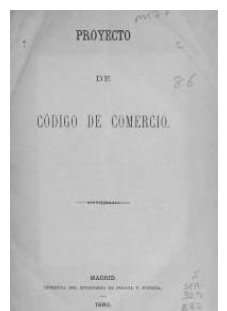
『スペイン商法典草案』(1882)

『1867年ポルトガル民法典 公式版』(1927) フェルナン・ルペルティエ『1867年ポルト