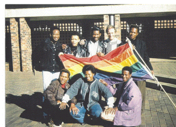
"Photographs Donated by Simon Nkoli." Simon Nkoli Collection, 1977 to 1998, Gale, a Cengage Company, 1990-2000. Archives of Sexuality and Gender, Gale Document Number DFMYRQ121639016

Gale 社はアメリカの性的マイノリティを主題にした Encyclopedia of Lesbian, Gay, Bisexual and Transgender History in America の刊行（2004 年）後、 Global Encyclopedia of Lesbian, Gay, Bisexual, Transgender, and Queer History を刊行（2019 年）し、非欧米圏の性的マイノリティに関する学術情報の欠落を補いました。この第4集では、二重の意味で忘れられた存在である非欧米圏の性的マイノリティの生の声を聞き取るべく、当事者たちの残された一次資料を電子化して提供します。