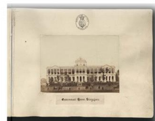
Government House, Singapore, 1850-1900 (CO 1069/484/2)

東アジア部門書簡集。ビルマ、マラヤ、北ボルネオ、サラワク、シンガポールの外交関係、アヘン貿易、妹仔問題、ゴム生産、戦後の軍事問題など。