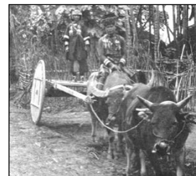
牛車(恒春畜産分所より)

□『台湾百年写真』は、日治期台湾の写真約 25,000 点の一大データベースです。原本には、出版物のほか、地方大観、会社史、報道写真、絵葉書等が使用されています。各写真のキャプション情報を可能な限りデータ化し、撮影地、撮影対象、人物といった観点から検索できます。地理情報システムを搭載し、撮影地が分かるものについては、地図上で閲覧可能です。当時の風俗、学校、鉄道、市街地等の状況を新たな切り口より捉えられます。