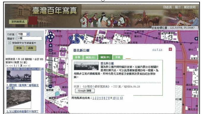
▲ 検索結果：写真・解説文(*)・関連資料へのリンクが表示されます。