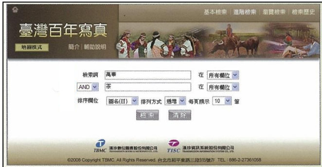
▲ 検索画面：写真のキャプション・解説文・原資料書名より検索できます。