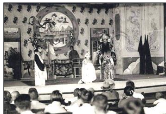
上海北京劇 小三麻子一座 (「始政四十周年記念臺灣博覽 會写真帖」昭和 11 年より)