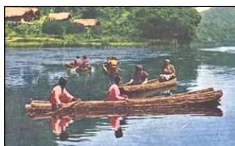
原住民的獨木舟 日月潭 (臺灣八景之一)(絵葉書)