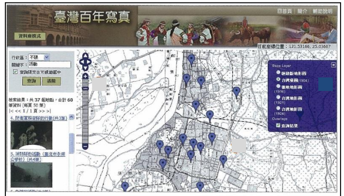
▲ 検索画面：行政区とキーワードより検索。撮影地点が地図上に表示されます。時代の異なる5種類の地図から選べます。