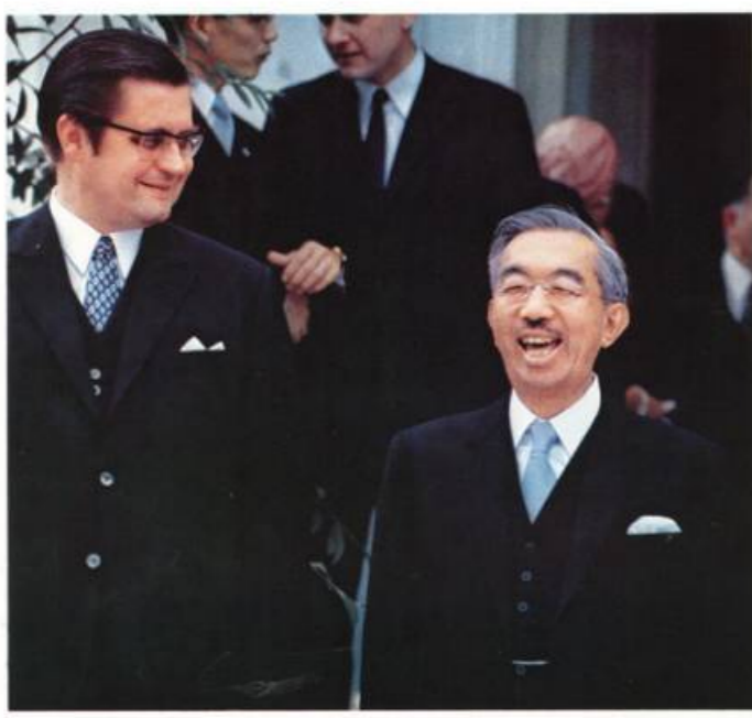
笑顔の天皇 皇后 ROYAL SMILES AND HAPPY LAUGHTERS