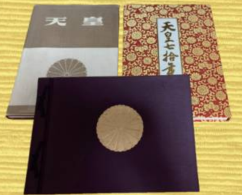
刊行時の書籍。下段は「皇室」。

●第4巻は国際情報社の「国際写真情報」から皇室を特集した号を抜粋。明仁上皇様のご誕生時の熱気が誌面より伝わってくる。 246頁