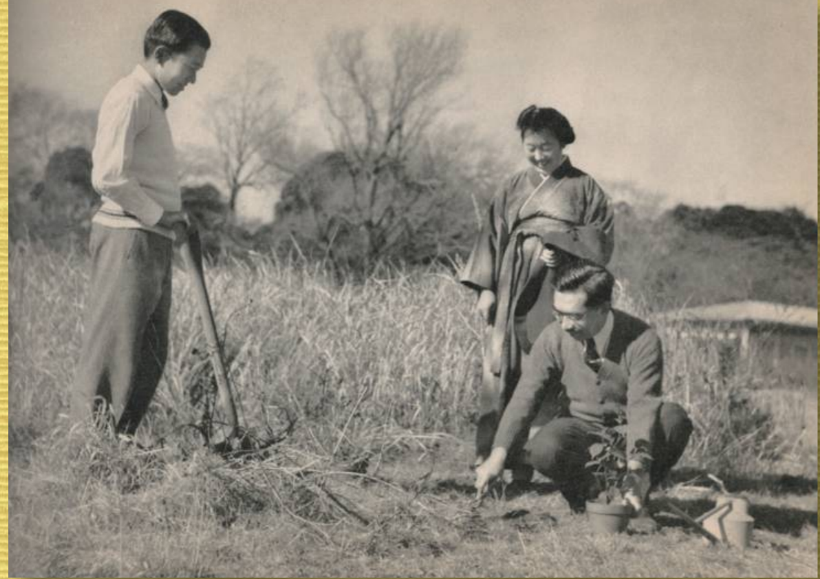
吹上御苑内庭に武蔵野の草木をご移植になる天皇陛下、皇后さま、皇太子さま

昭和天皇(しょうわてんのう、1901年(明治34年)4月29日—1989年(昭和64年)1月7日)は、日本の第124代天皇(在位：1926年(大正15年)／昭和元年)12月25日—1989年(昭和64年)1月7日)。諱は裕仁(ひろひと)、御称号は迪宮(みちのみや)。明確な記録が残る歴代天皇の中で在位期間が最も長く(62年及び14日間)、在位中に崩御した天皇としては最高齢である。