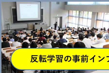
反転学習の事前インプット教材