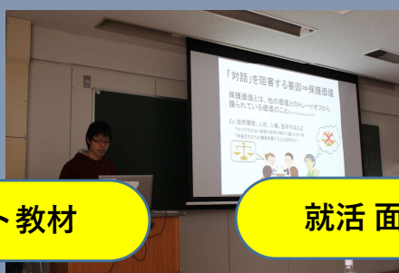
就活 面接対策のインプット教材